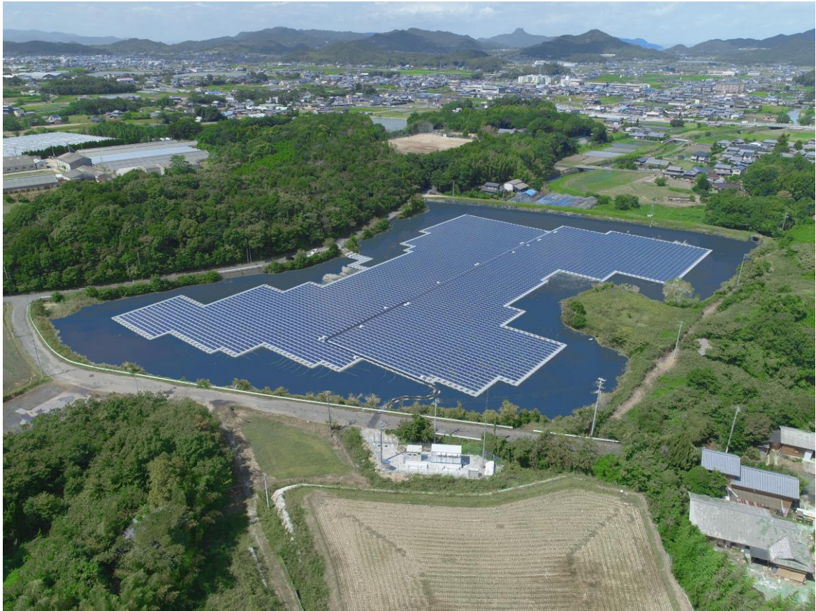
(写真上：御田神辺池ソーラー発電所 空撮)