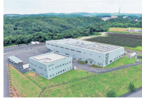
本社・スマートソーラー技術研究所