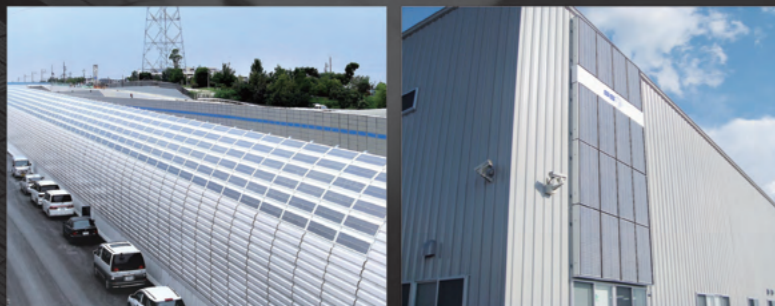
NEXCO西日本 120kW 高速道路路過音壁一体型