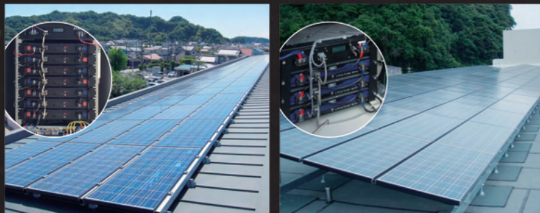
千葉県銚南町 銚南小学校 30kW・蓄電池32kWh