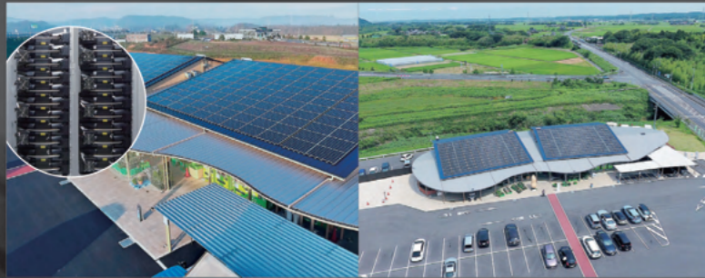
「道の駅木更津 うまくたの里」 81kW・蓄電池81kWh